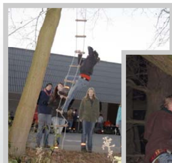
Boven: met de touwladder de boom in!